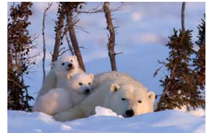
Canon EOS-1Ds Mark II, 600.0 mm, 600 mm, f9, 1/125s, ISO 320