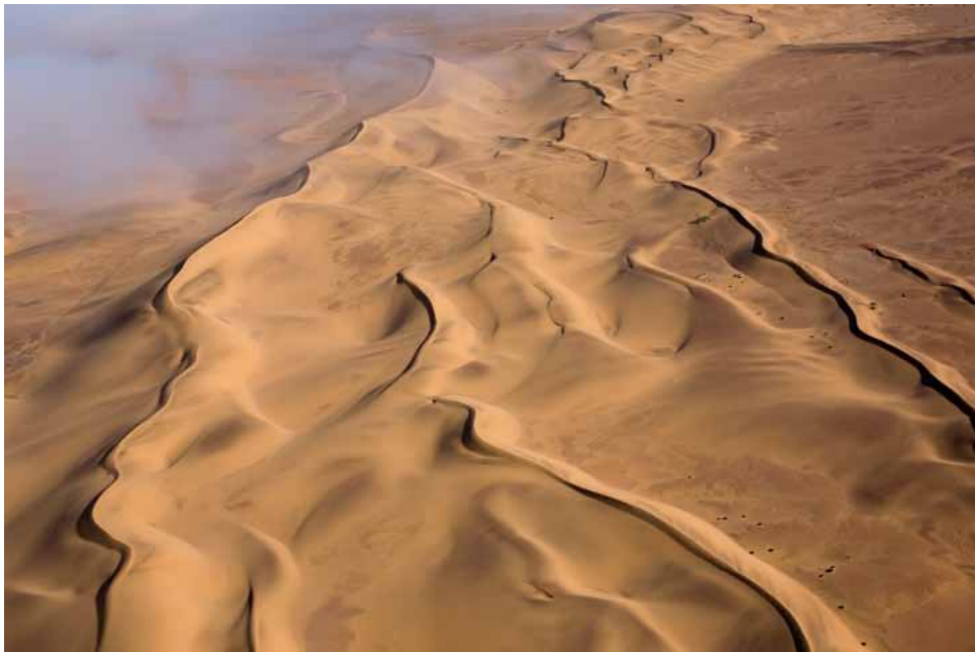
Canon EOS 5D, 50.0 mm, 50 mm, f11, 1/160s, ISO 200

Für Thorsten Milse war es zuweilen alles andere als leicht, an Aufnahmen zu gelangen, die seinem Anspruch genügen, „beim