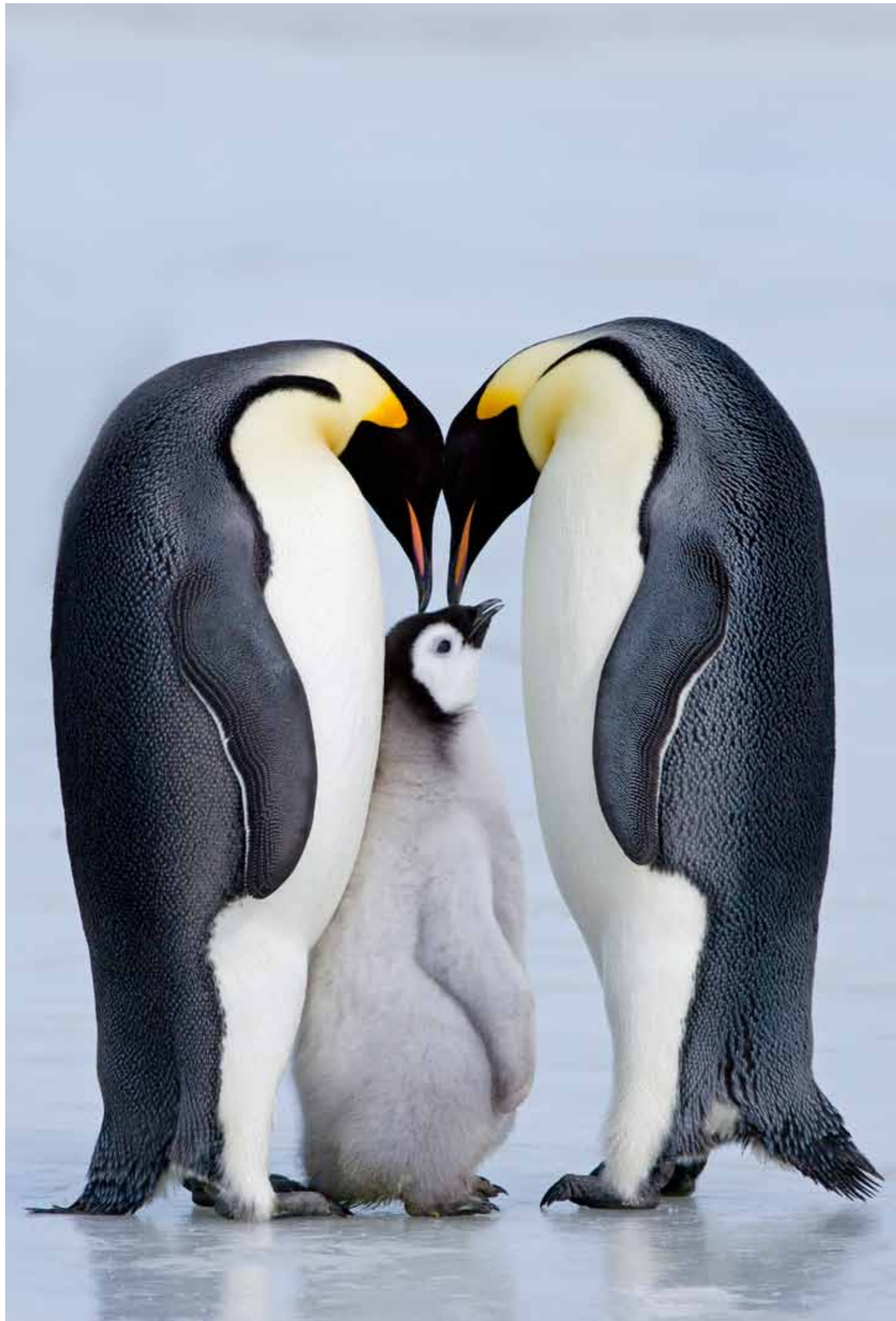
Canon EOS-1Ds Mark II, 600.0 mm, 600 mm, f10, 1/1000s, ISO 100