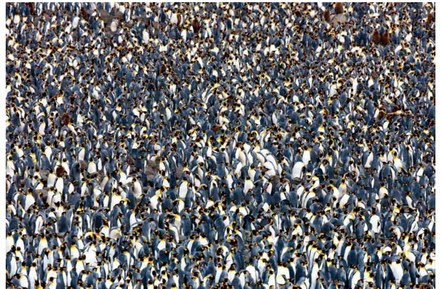
Canon EOS-1Ds Mark III, EF500mm f/4L IS USM, 500 mm, f8, 1/800s, ISO 400

Betrachter einen traumhaften Eindruck zu hinterlassen und seine Neugier für diese Einmaligkeit zu wecken“. Häufig erschwerte ihm dichter Nebel seine Arbeit. „Die gesamte Landschaft war in dichtes Nichts getaucht“, schreibt der Fotograf in seinem neuen Bildband. Das machte das Fotografieren vom Propellerflieger aus nicht nur fast unmöglich, sondern auch gefährlich. Bei klarer Sicht hingegen sind Bilder aus der Luft optimal, „um die Dimensionen der Skelettküste sichtbar zu machen“, betont Milse. Ebenso an der Tagesordnung waren Sandwinde, die zwar für eine tolle Lichtstimmung sorgten, jedoch auch für Geknister auf der Objektivlinse.